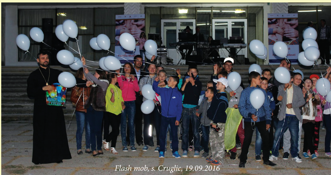
Flash mob, s. Cruglic, 19.09.2016

Amintim că alte acțiuni care fac parte din aceeași campanie de consolidare a familiei și de promovare a valorilor familiei creștine unite în jurul evenimentelor importante pentru comunitate, au fost: expoziția cu vânzări a lucrărilor confecționate de către persoanele cu dizabilități, organizată la 20 aprilie și două flashmoburi cu genericul „O rugăciune și un gând bun pentru Familia Moldovei” – organizate la 15 mai, în Scuarul Catedralei din Chișinău, cu ocazia Zilei Internaționale a Familiei și la 19 septembrie, în raionul Criuleni, de Hramul satului Cruglic.