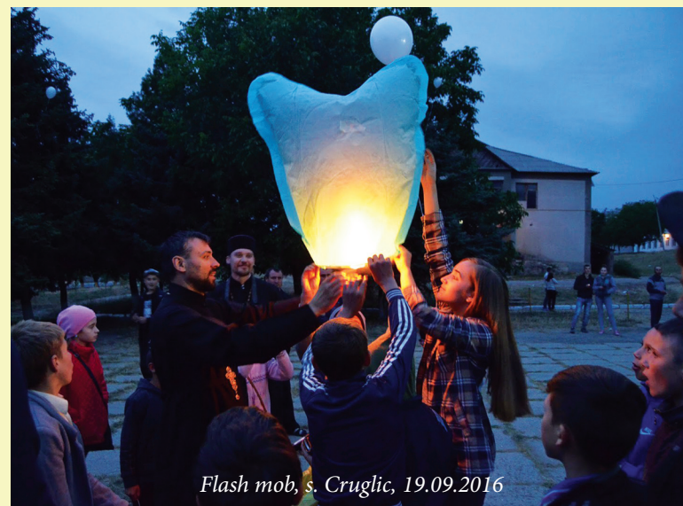
Flash mob, s. Cruglic, 19.09.2016